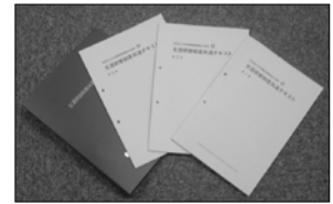
生涯研修制度共通テキスト 本テキストがないと受講できません

受講費 構成員 4,500円(うちテキスト代2,500円) 非構成員 5,500円(うちテキスト代2,500円)